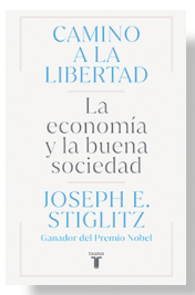
CAMINO A LA LIBERTAD JOSEPH STIGLITZ Sello: Taurus Págs: 408 Precio: $ 20.000

No es que en general estemos fuera de contacto con las necesidades y preocupaciones de la gente corriente. Pero creo que existen barreras lingüísticas. Incluso describir esto como “barrera lingüística” es una barrera. Como académicos, tendemos a tratar de ser más precisos en el lenguaje. Y si nos fijamos en el lenguaje que utiliza Trump, no es muy refinado, pero comunica. Está lleno de odio, veneno, y comunica emocionalmente un conjunto de preocupaciones. ●